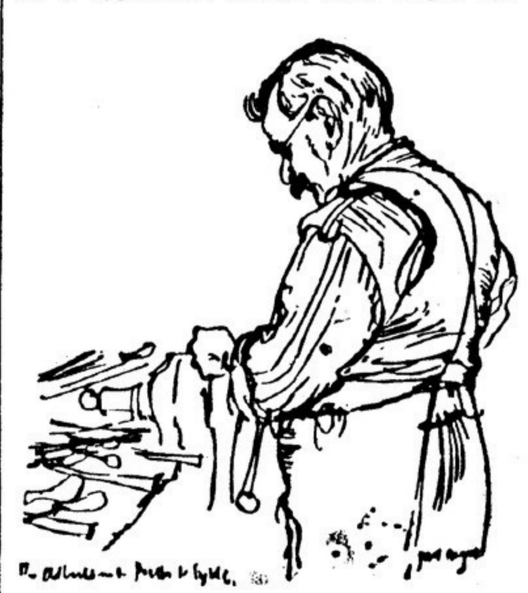
Старый слесарь из Бэлквуда. Рисовка английского художника Пола ХОГАРТА

этой страной. В обмен на продовольствие из Восточной Европы английские рабочие могли бы производить текстиль в оборудованные для текстильных фабрик, электротехническое, изделия, пометные краны и грузовики. Вместо этого люди, при-